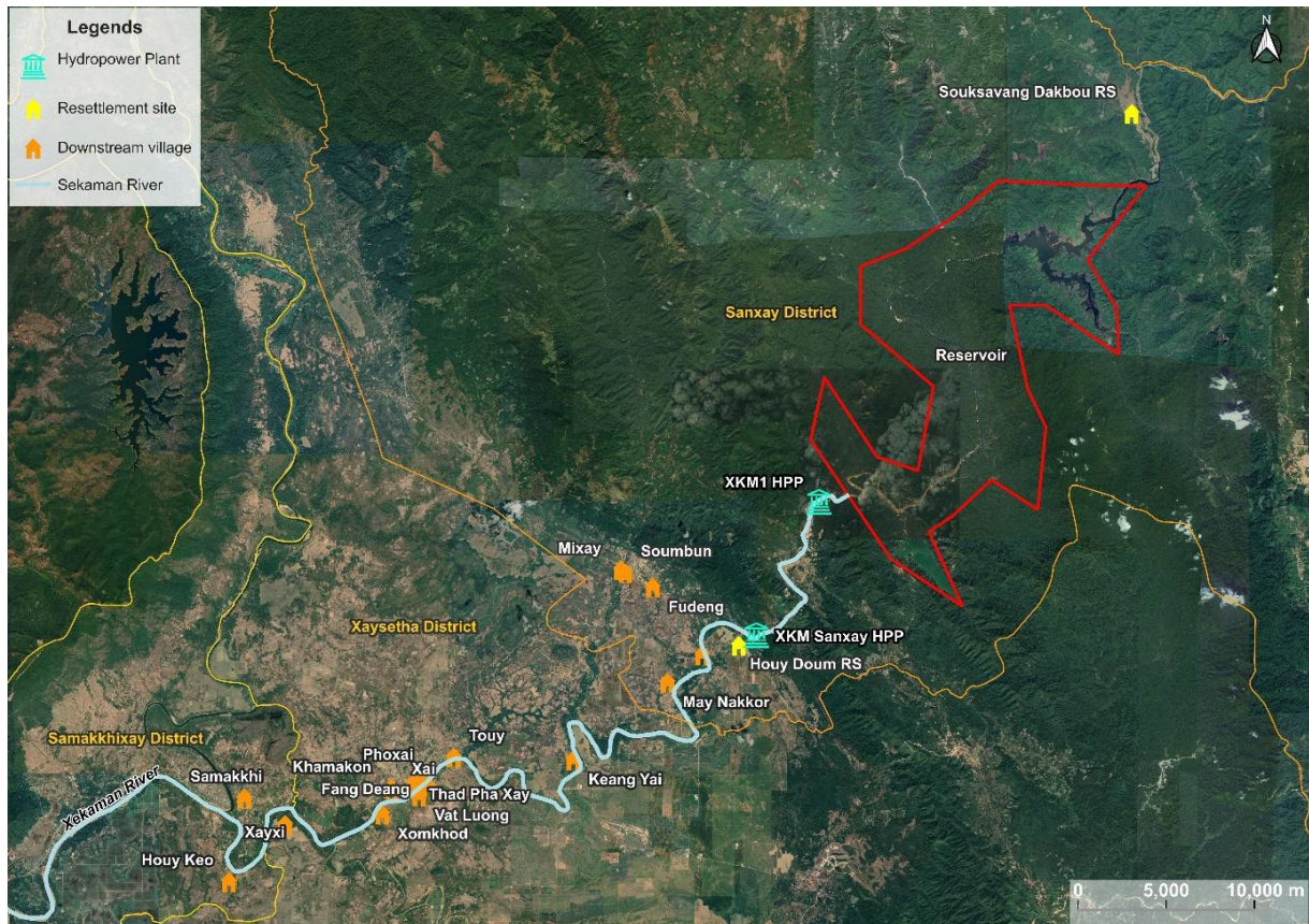
Hình 1.1 Vị trí của các bản bị ảnh hưởng (tính đến tháng 10 năm 2022)

Phân tích và lập bản đồ các bên liên quan bao gồm việc lập hồ sơ các bên liên quan dựa trên mối quan tâm của họ (môi trường, xã hội, kỹ thuật) và lập bản đồ dựa theo mức độ ảnh hưởng và mối quan tâm của họ đối với Dự án. Phân tích này giúp xác định các chiến lược tham gia phù hợp cho từng nhóm bên liên quan. Ma trận được trình bày trong Hình 1.2 phân loại các bên liên quan dựa trên sự quan tâm và ảnh hưởng của họ đối với Dự án.